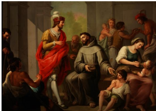
Imagen: San Francisco y los pobres - Camarón Bonanat, José (pulsar sobre la imagen para verla más grande).