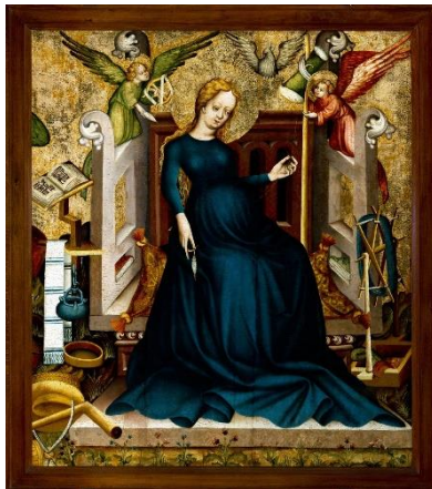
Imagen: La Virgen embarazada de Németújvár - Unbekannt Unbe-kannt (pulsar sobre la imagen para verla más grande)

Nosotros también tenemos fe y creemos que Jesús permanece con nosotros y que cada Navidad lo recordamos y deseamos que llegue su cumple y por eso lo hacemos con alegría; pero debemos prepararnos.