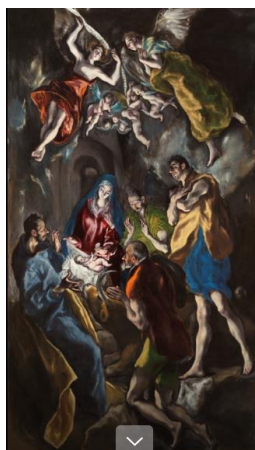
Imagen: Adoración de los pastores- El Greco (pulsar sobre la imagen para verla más grande)

Explicación: La última semana. Jesús ya está aquí. ¡Todo listo! Deberíamos celebrarlo todos juntos. ¡Es una fiesta! Al menos, que todo el mundo viera lo que hacemos o la cara que ponemos, que estamos contentos de celebrar y recordar el nacimiento de Jesús. Muy importante, cuando nos encontramos en casa con la familia, tener una imagen de un Niño Jesús. Él es el protagonista, ¡no lo olvidemos! Es su cumpleaños y gracias a Él se celebran estas fiestas.