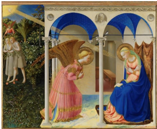
Imagen: La Anunciación - Fray Angélico (pulsar sobre la imagen para verla más grande)

Explicación: La esperanza es lo último que se pierde , dice un dicho popular. Los cristianos creemos en la providencia de Dios. Debemos pensar que todo ocurre por alguna razón. Debemos confiar en los planes de Dios. La Virgen María confió en las palabras del Ángel Gabriel, José confió en María, Juan Bautista confiaba en su primo Jesús...y así mucha gente ha confiado y confía. Esperamos la Navidad con alegría y confiamos en las personas que nos quieren y quieren lo mejor para nosotros; aunque a veces nos cueste hacer según qué cosas.