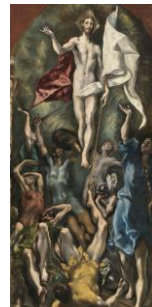
La Resurrección de Cristo, El Greco 1597 - 1600. Óleo sobre lienzo, 275 x 127 cm Sala 009B Museo del Prado (Madrid)